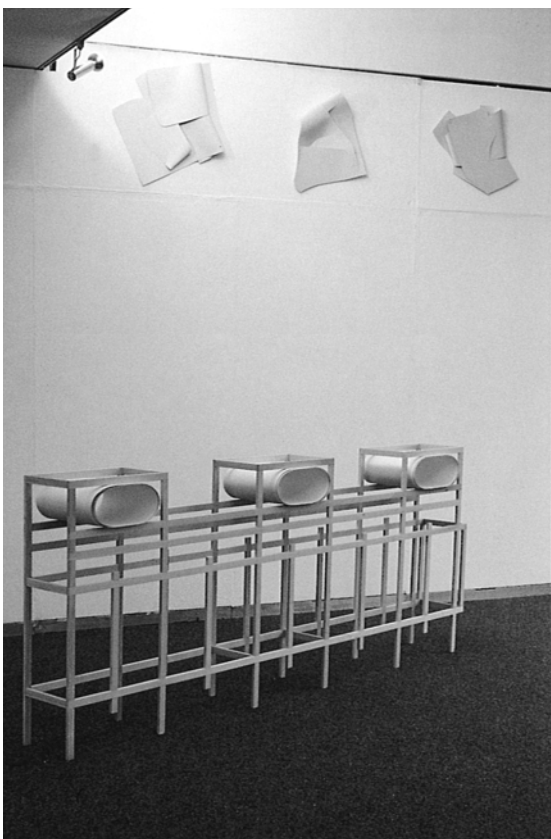
2. Tipologia , 1988, Köln, Kunstverein (part./detail)

quelle degli esordi (radicale alleggerimento dei materiali di partenza, introduzione della linea curva e della piega, progressivo avvicinamento alla pratica pittorica ecc.) non è indice di un mutamento di paradigma ma, più semplicemente, di differenti modalità della sua articolazione. Ciò risulta chiaro se, invece di porre l'accento sugli aspetti differenziali dei singoli lavori, ipostatizzandoli, prendiamo in considerazione ogni serie nel suo comples-