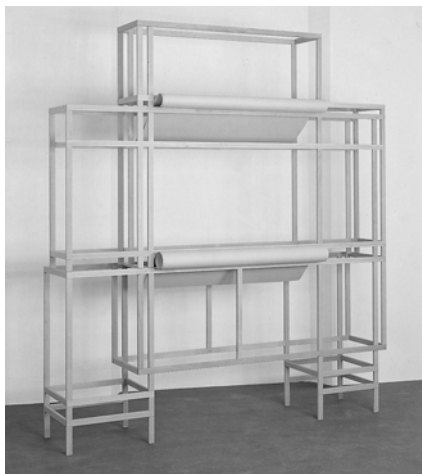
4. Tipologia, 1988

Ciò che in questi lavori si manifesta come struttura, è solo la momentanea cristallizzazione di un differire potenzialmente infinito: la loro forma si costituisce, infatti, come tale solo in quanto si rapporta ad una non-presenza: ciascun elemento che appare sulla scena, come il fotogramma di un film astratto, conserva la traccia di un elemento passato e si lascia intaccare dal rapporto con un elemento futuro. L'opera da così luogo ad un movimento immobile che istituzionalizza proprio mentre lo rende potenziale (e dunque, in un certo senso, superfluo) il provvisorio