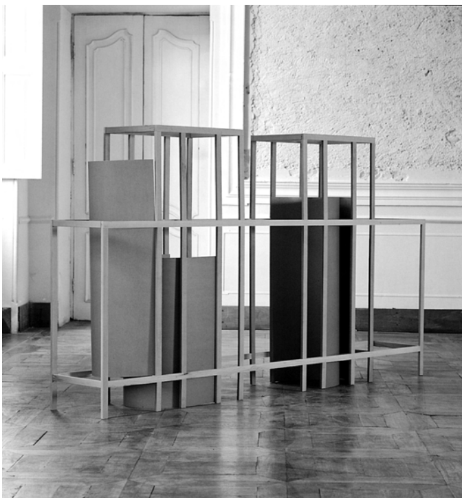
5. Tipologia, 1988 , Castello di Rivara (Torino)

(8) G. Agamben, Stanze , Torino, 1993 (1°ed. 1977).