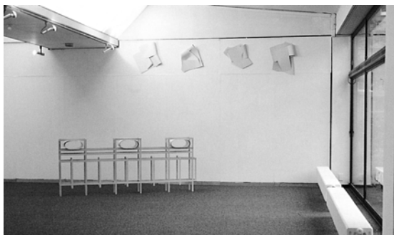
1. Tipologia, 1988; Modelli, 1988 Köln, Kunstverein

zione, preliminare e costitutiva, riassumibile nella formula né... né , il paradigma che orienta la sua ricerca; si tratta di una formula che va intesa ponendo maggior ascolto all'originaria duplicità del gesto che la fonda (sottraendola ad ogni semplice opposizione binaria) più che alla sua stessa negatività : un né questo né quello